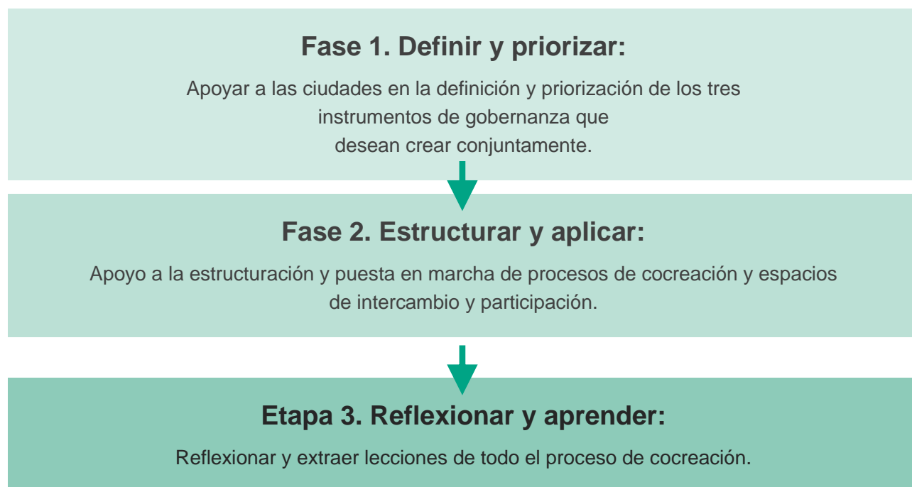
Figura 1: Diferentes etapas del proceso de cocreación.

Durante la primera fase, el equipo desarrolló herramientas a medida que pudieran adaptarse a las necesidades de cada ciudad, incluida la clarificación de prioridades, escalas de trabajo y objetivos de colaboración. Se creó una plantilla para mantener una visión interna de los instrumentos políticos seleccionados por las ciudades. Esto permitió alinear la retroalimentación con el objetivo de cocreación en el diseño de instrumentos políticos. Los debates tuvieron lugar durante las reuniones de los Puntos Focales de las Ciudades, lo que facilitó el aprendizaje mutuo y el intercambio entre las ciudades. Además, se elaboró un documento de preguntas y respuestas para poner en marcha el proceso, en el que se ofrecía información clave, ejemplos, pasos, calendario y puntos de contacto. El objetivo era crear conjuntamente tres instrumentos de gobernanza por ciudad. Su aplicación durante el proyecto no era un requisito previo, pero el objetivo era desarrollar un conjunto de instrumentos prácticos para abordar las oportunidades y necesidades identificadas en cada ciudad socia de INTERLACE. Los instrumentos deberían haber alcanzado una fase "lista para ser aplicada" durante la duración del proyecto.